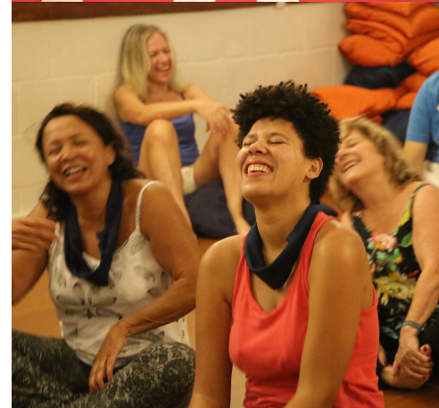
Grupos facilitados por terapeutas formados na Terapia BodyOshean®