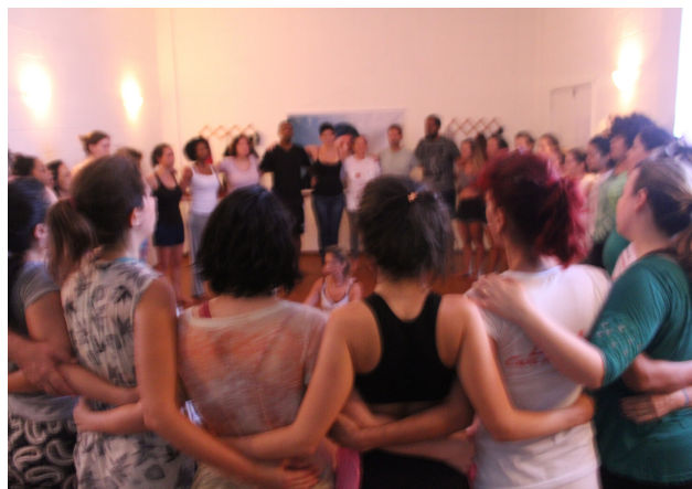
As aulas são intercaladas por vivências, danças e meditações. Sempre para elevar a carga energética dos futuros terapeutas.

Serão estudadas as origens do trauma, numa linha do tempo através das fases de desenvolvimento da criança, observando-o nos registros corporais, percebendo que são passíveis de serem identificados, e experienciar as possibilidades de desbloqueio das couraças musculares que impedem o livre e saudável desenvolvimento humano.