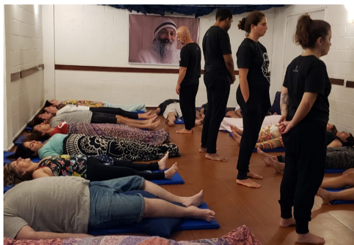
Formandos atuando em Núcleos de Desenvolvimento.

Como parte da experiência prática a Casa de Lakshmi oferece aos seus formandos excepcionais espaços de desenvolvimento. Dispõe de Núcleos de Desenvolvimento de Bio-BodyOshean (Bioenergética), de Renascimento, de Tantra Clínico e de Reiki, este último no Ambulatório Social da Ong Reiki Sem Fronteiras Brasil. Os treinandos são supervisionados por outros terapeutas já formados pela Casa de Lakshmi, e pelos coordenadores da Formação.