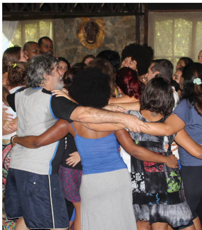
Alunos na etapa Básico - turma anterior

Vai sentir e viver nosso clima, dançar, celebrar, e vai viver uma explosão de emoções!