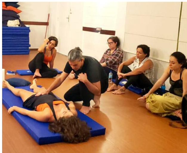
Demonstração de um atendimento de Bioenergética