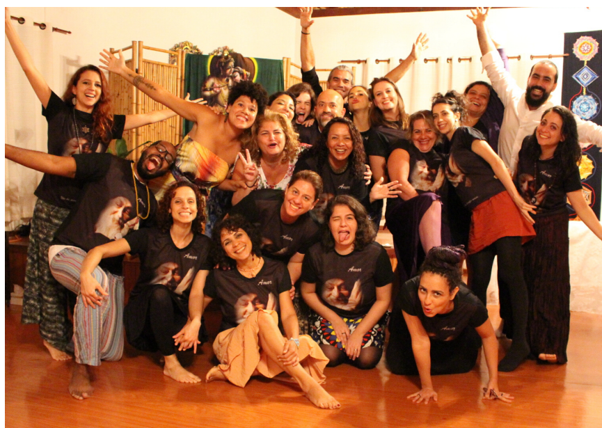
Formatura - turma de 2017

No último módulo do avançado faremos uma grande e divertida festa de formatura! Prepare-se!!!! 😊