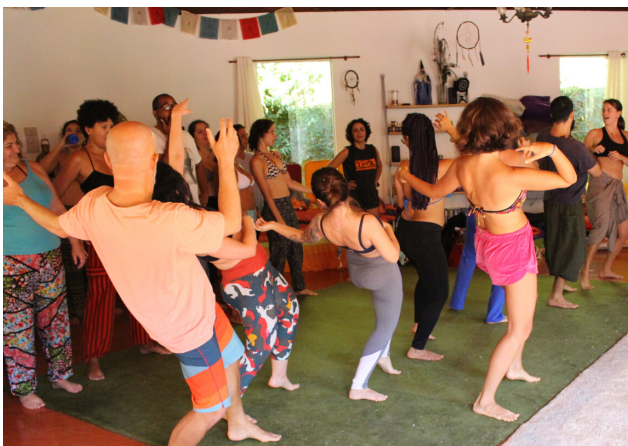
Profissionalismo anda lado a lado com a descontração, diversão, relaxamento e arte!